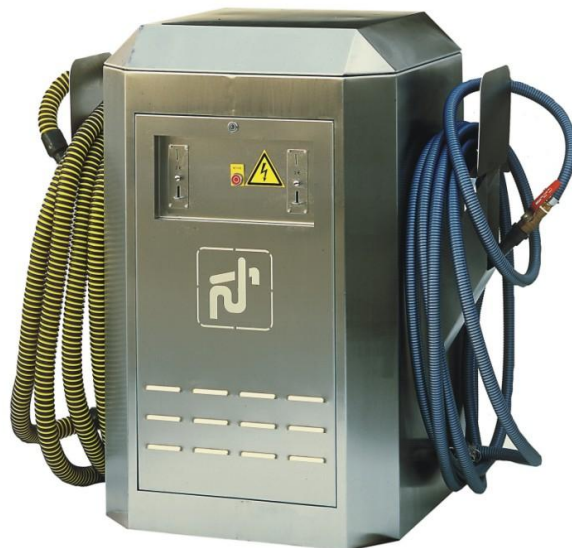
Part No. LS160W-B